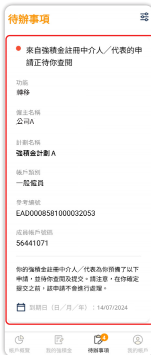
2 於主頁選單上按「待辦事項」，然後選擇相應待辦事項。