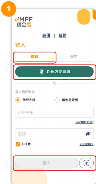
1 登入積金易流動應用程式